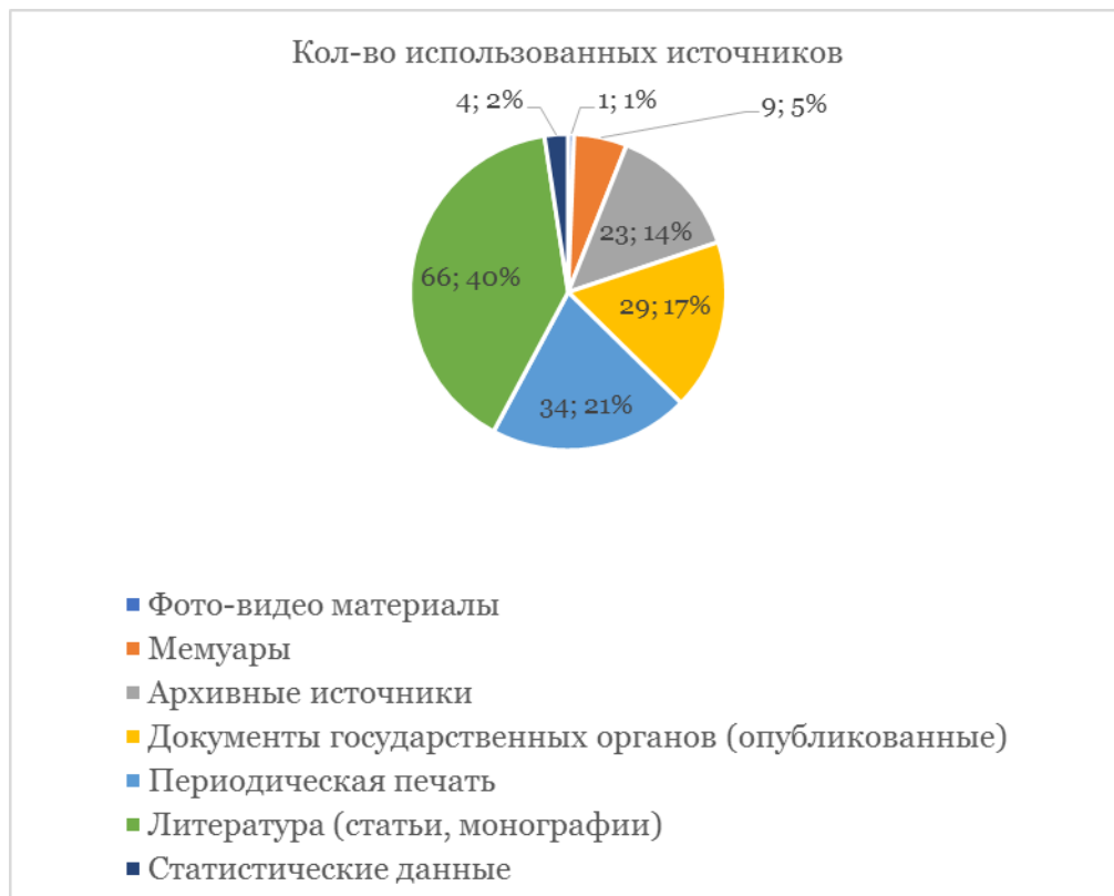
Рис. 2. Типы использованных источников в статьях по региональной истории кризиса, взаимодействию центра и регионов

Кроме того, стоит обратить внимание на источники, на которых базировались исследователи в разных категориях. Для этого целесообразно будет составить таблицу и вносить в нее данные из библиографического списка всех авторов (за исключением историографических исследований, в которых ссылаются, естественно, на литературу). Для каждой рубрики составлена отдельная диаграмма. Например, вот распределение источников в публикациях по региональной истории кризиса, взаимодействию центра и регионов (см. Рисунок 2 ):