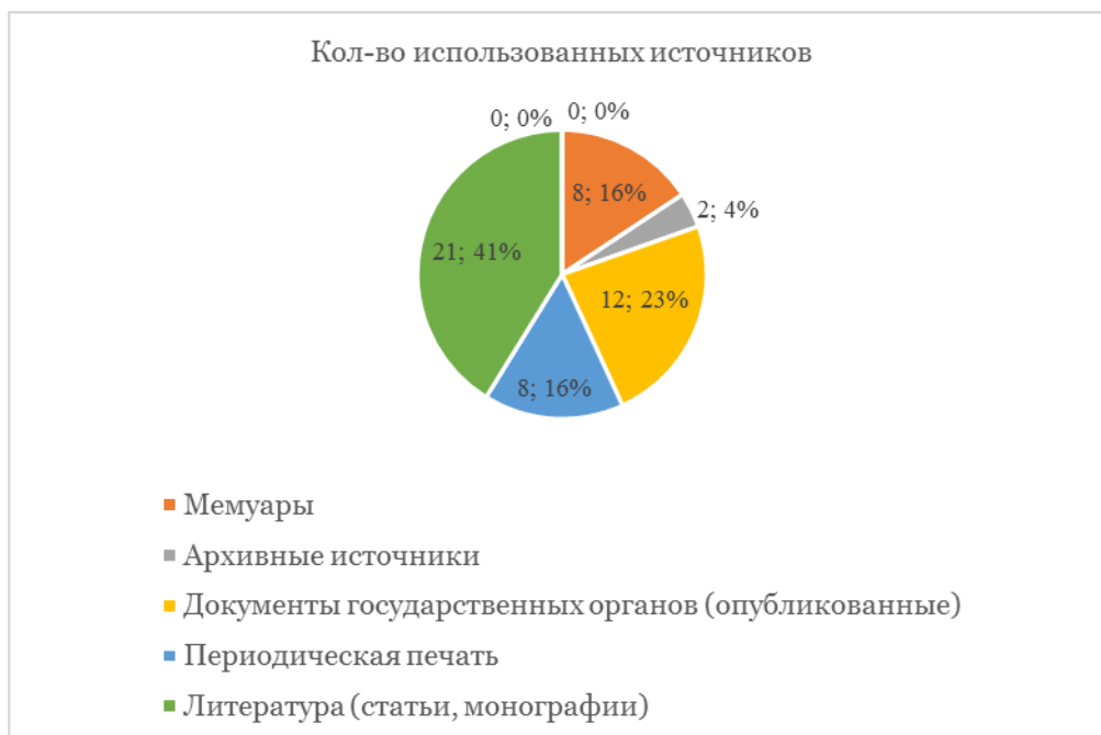
Рис. 3. Типы использованных источников в публикациях о высших органах государственной власти

А вот так выглядит общая картина (см. Рисунок 4 ):