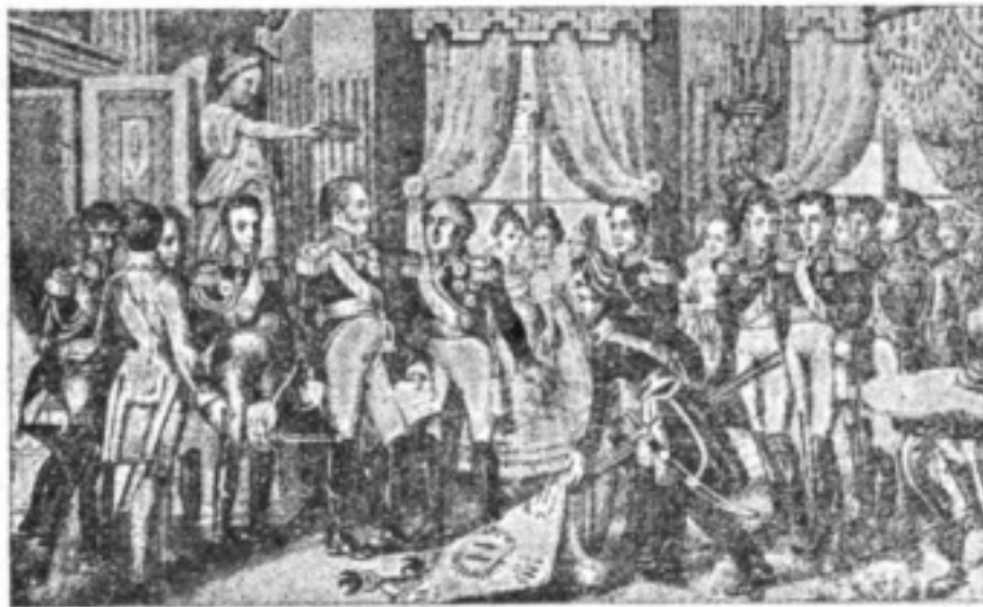
Императоръ Александръ I въ Вильно въ 1812 г.

Первое время своего пребывания въ Вильно Государь посвятилъ преимущественно объѣзду и осмотру войскъ Первой арміи, для чего посѣтилъ Шавли, Гродно и Вилькомиръ 2) . Всѣ войска нашель