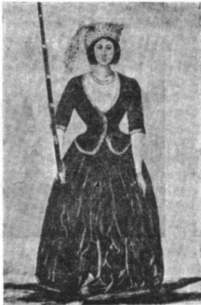
Костюмъ амазонки въ 1787 году.

Осмотрѣвъ бухту и крѣпость, вѣщепосыльный путешественникъ возвратился къ Императрицѣ и уже пріѣхалъ во второй разъ къ Кадыкіою съ Ея Величествомъ и княземъ Потемкинымъ въ ея каретѣ.