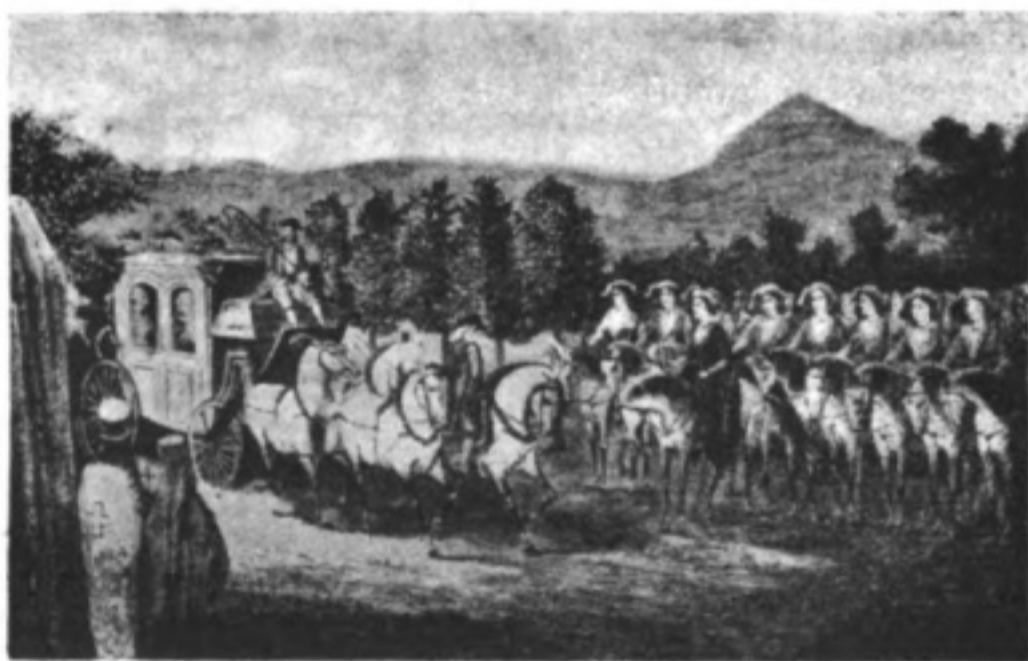
Встрѣча Екатерины II ротой амазонокъ въ 1787 году (со старинной литографіи).