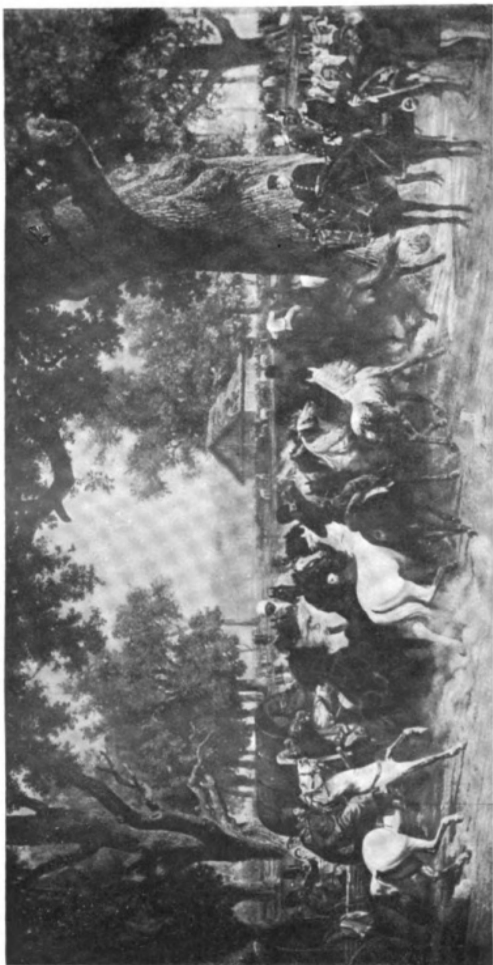
Встрѣча табуна лошадей прибывшаго съ нагайцами въ Дессау въ 1857 году прусскимъ королемъ Вильгельмомъ I и герцогомъ Дессаускимъ.