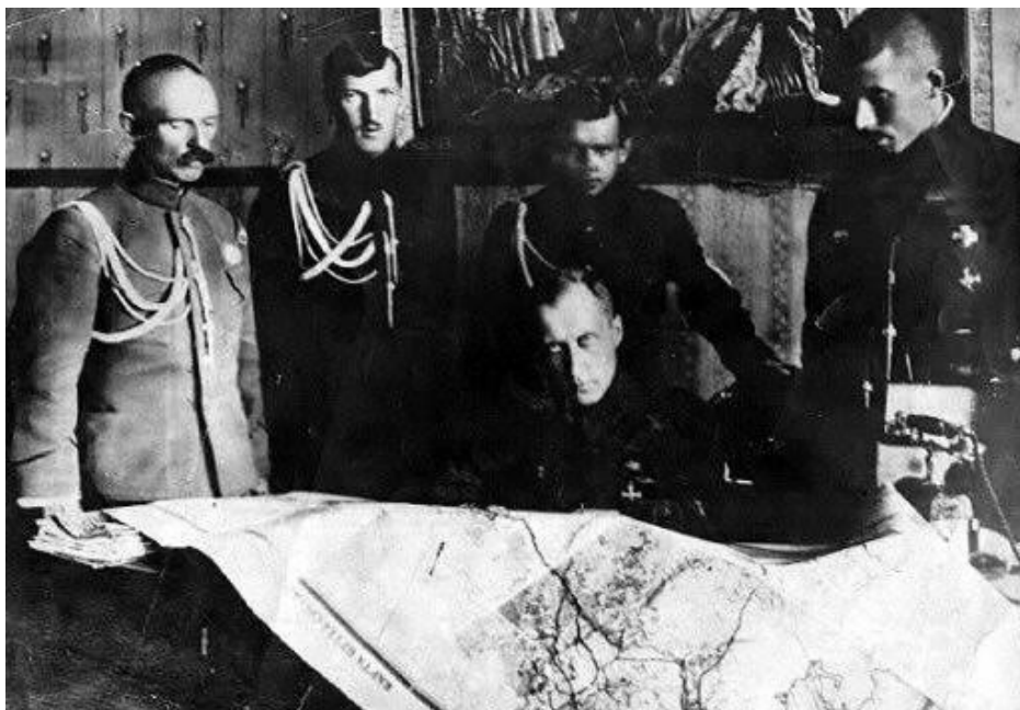
Рис. 2. А.Н. Гришин-Алмазов в штабе. 1918 г.

М.Б. Шатиловым. Но 30 июня его состав изменился, и оно стало более правым [10], что повлияло на взаимоотношения с казахской автономией. К тому же в Сибирском правительстве все большее влияние приобретал командующий армией и глава военного ведомства А.Н. Гришин-Алмазов, который довольно быстро склонился в сторону военной диктатуры. В итоге отношения с Алаш, чье правительство стремилось отстаивать принципы федерализма и равноправия с другими автономиями, приобретали все более напряженный характер. Сибиряки позиционировали себя в качестве центра, предполагая подчинение себе Алаш.