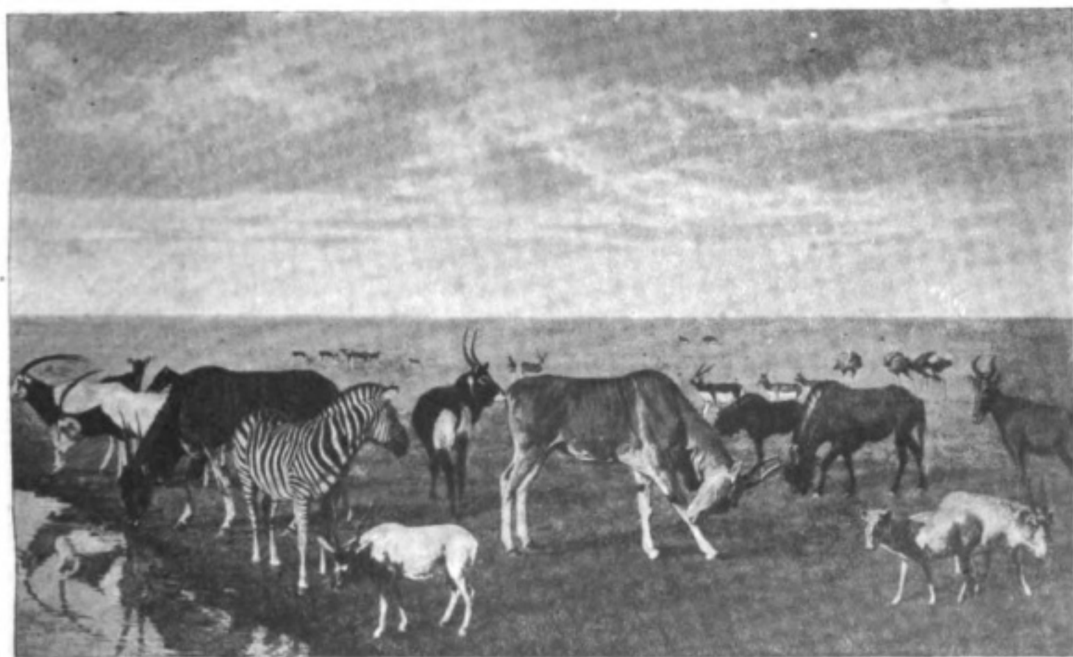
Асканійскій зоопаркъ. У водооя: зебра, олене-быки, сабельныя антилопы, гну, сайгаки и друг.