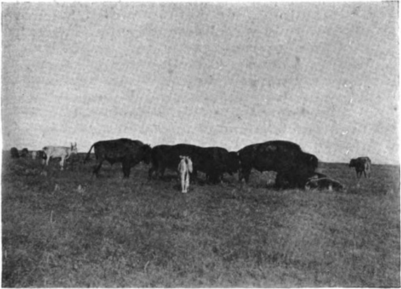
Асканія Нова. Американскіе бизоны въ степи, рядомъ съ украинскимъ скотомъ.