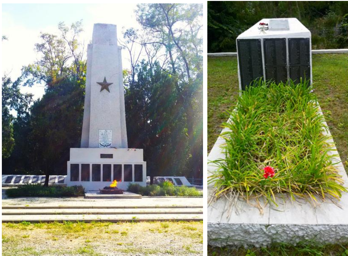
Рис. 1. Мемориал с Вечным огнем. Сентябрь 2022 г.

По бокам от обелиска располагаются тумбы, на которых были установлены бронзовые скульптуры воина и женщины-воина, утраченные в 1990-е гг. (см. Рисунок 2). Согласно учетным карточкам, это два отдельных захоронения, но мы их рассмотрим в рамках мемориала с Вечным огнем, поскольку композиционно они составляют единый комплекс.