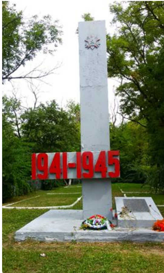
Рис. 3. Военское захоронение № 61-1100. Сентябрь 2022 г.