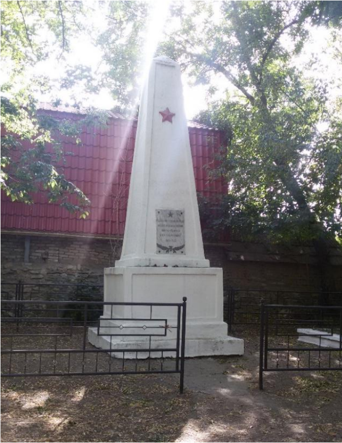
Рис. 6. Военное захоронение №61-1096. Сентябрь 2022 г.

В донесениях о безвозвратных потерях причиной выбытия значится потеря ориентировки лидером, вследствие чего ведомые самолеты сели на аэродром, занятый врагом. Легчики служили в 291-м истребительном авиационном полку 265-й истребительной авиационной дивизии ( Донесение о безвозвратных потерях ).