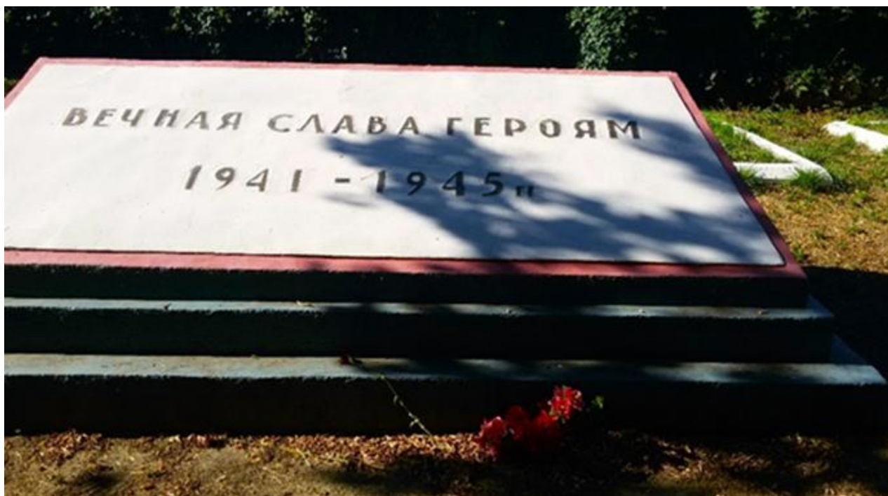
Рис. 5. Воинское захоронение №61-1097. Сентябрь 2021 г.

5. Воинское захоронение №61-1097. Надгробие на братской могиле выполнено в форме усеченного четырехгранника из кирпича, отделанного цементным раствором, высотой 1,3 м (см. рис. 5). Размеры основания – 2,5 x 4,6 м. Размеры захоронения – 4 x 9 м. На всей плоскости надпись: «Вечная слава героям 1941–1945 гг.». Поименный список отсутствует. В новой карточке фигурирует как могила Неизвестному солдату. Памятник установлен в 1947 г. Над ним шефствует завод «Прибой» ( Учетная карточка № 8 ).