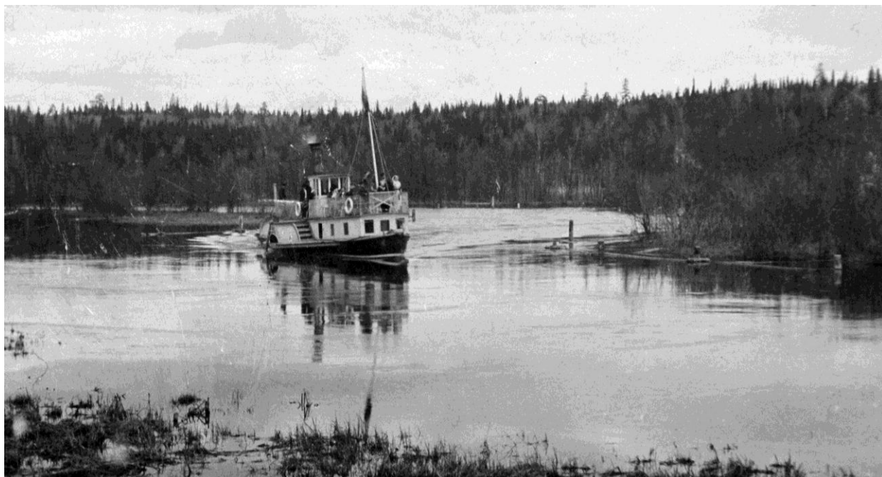
Пароход «Иж» в верховьях Ижевского пруда