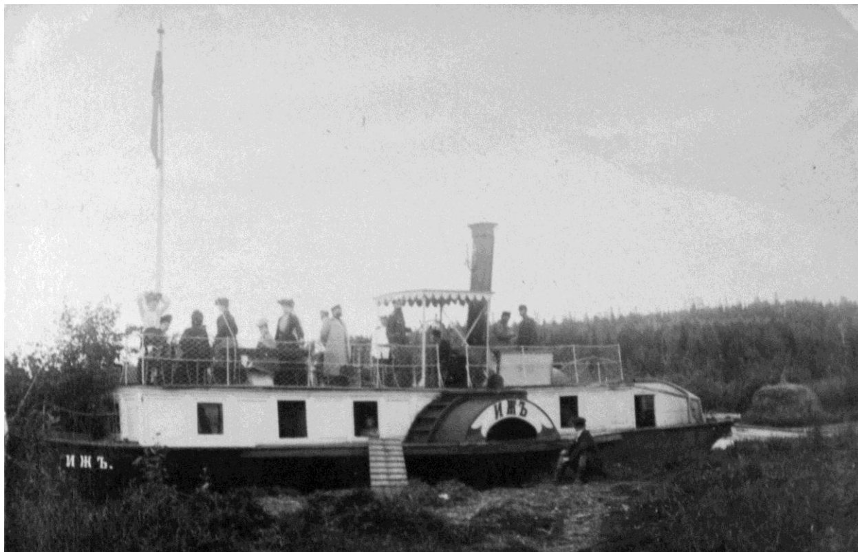
Пароход «Иж» на Ижевском заводе (колл. О.В. Севрюкова, ЦГА УР, ф. 1539, оп. 2, д. 297/1)