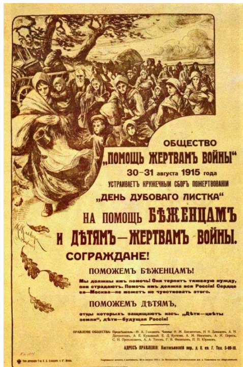
Плакат общества «Помощи жертвам войны». Первая мировая война