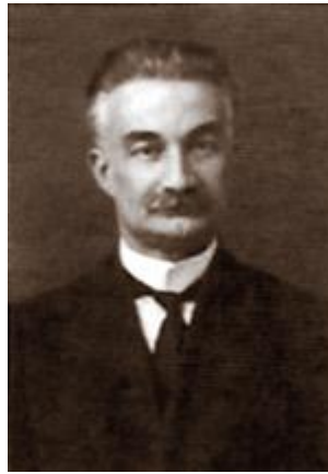
Фото 1. Иван Александрович Джавахишвили

отдельных вопросов истории Грузии. Глубокое и систематизированное изучение истории Грузии полностью было возложено на одного человека. Ему пришлось взвалить на свои плечи очень тяжёлый груз и первому проложить дорогу другим наукам. Позднее Иван Джавахишвили писал: «К моему великому сожалению, у меня никого не было, кто мог бы разделить со мной эту ношу и из-за нехватки времени я был в таком состоянии, что даже для проверки написанного не хватало времени». (Р. Метревели, Тб., 2012. с. 6).