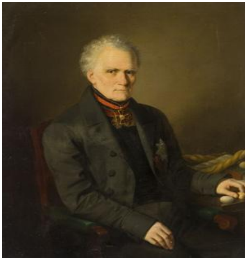
Ф. Торопов. Портрет А.Ф.Реброва, (1853). Государственный исторический музей

Среди награжденных по этому случаю российских чиновников упоминается и Ребров. За проделанную работу Алексею Федоровичу был пожалован 19 сентября 1801 г. чин коллежского асессора, он получил 200 душ крестьян. В дальнейшем он обрел дворянство и был вписан в Дворянскую родословную книгу Кавказской губернии [4]. В части третьей под номером тринадцать было записано: «Ребров, надворный советник, губернский предводитель дворянства Алексей Федорович, 31 декабря 1814 г. по полученному 19 сентября 1801 г. чину коллежского асессора (143 муж., 140 жен.)» [5]. За эту грамоту А.Ф. Ребров заплатил внушительную по местным меркам сумму в 100 рублей серебром.