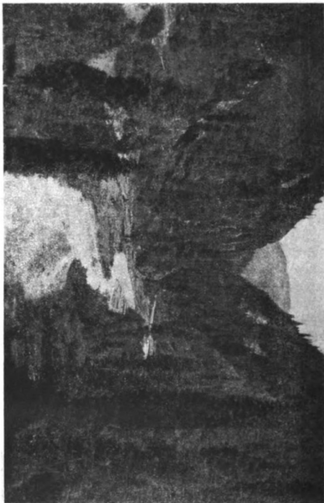
Джеттогузское ущелье (вверхъ отъ ключей).

сѣдствѣ прекраснаго незамерзающаго бассейна Песыкъ-куля—съ другой. Будучи поднятъ на 5.400 футовъ надъ моремъ, Пржевальскъ питается холодными прозрачными водами рѣчки „Караколь“ („Черная рука“), берущей начало въ каракольскихъ ледникахъ и впадающей въ двѣнадцати верстахъ ниже города, въ