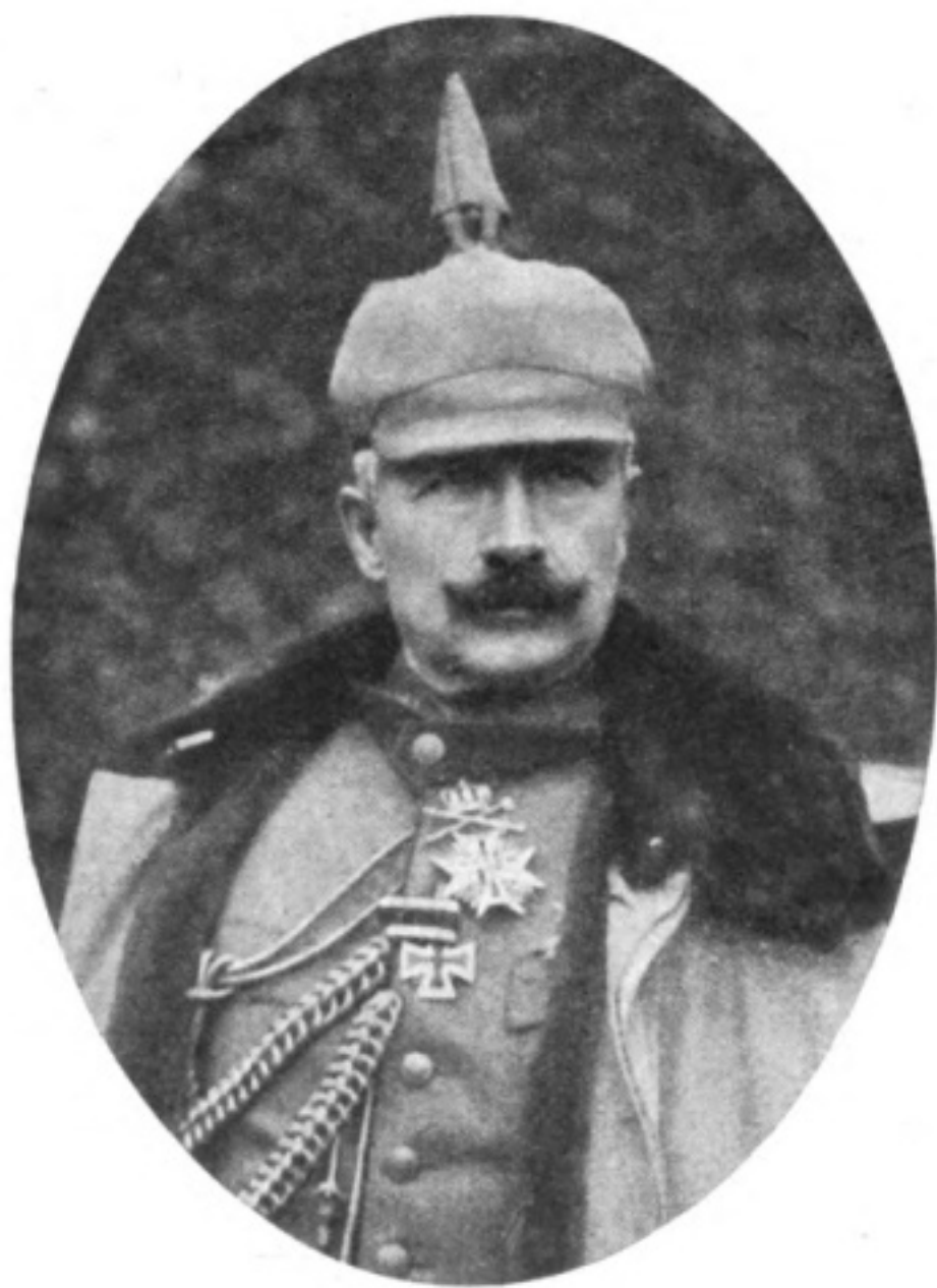
Наши враги: Германскій императоръ Вильгельмъ II.