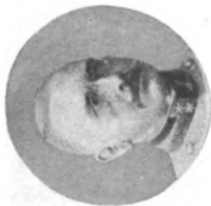
Наши враги: Австрійскій генералъ Данкль, командовавшій въ ноябрь Краковской арміей.