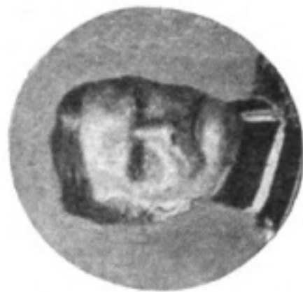
Наши враги: Генералъ Макерзенъ, ко- мандовавшій германскими корпусами въ первомъ сраженіи подъ Лодзью.