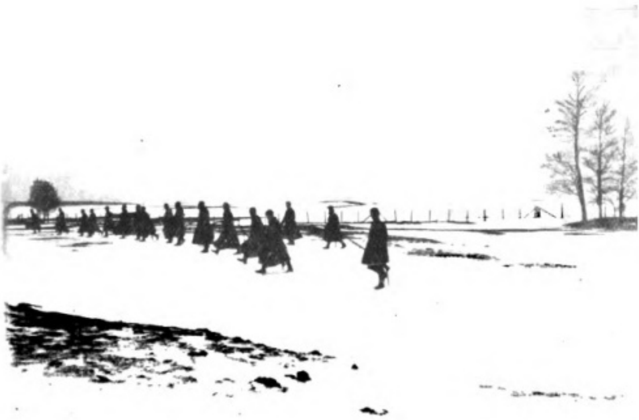
Въ восточной Пруссіи: На развѣдкѣ.