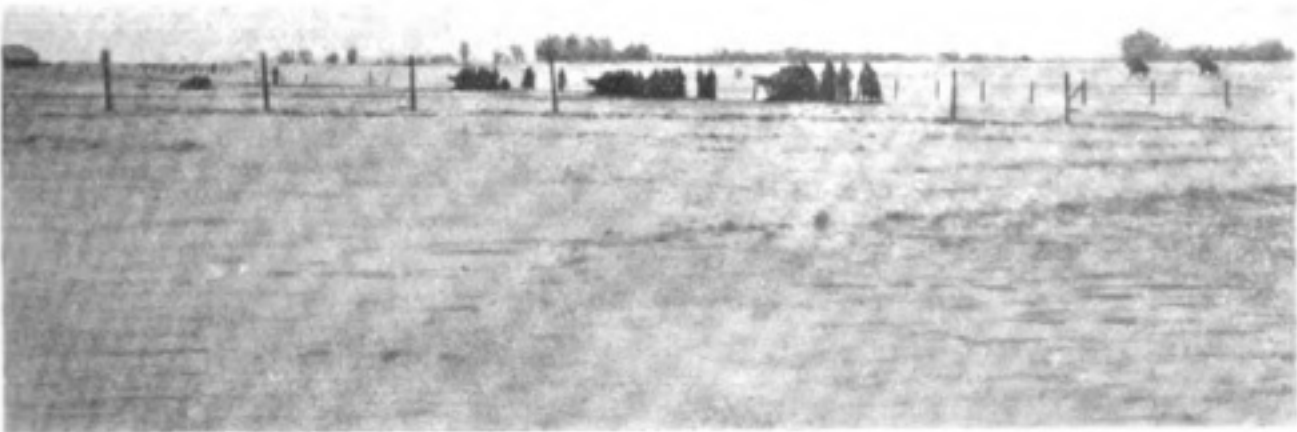
Въ восточной Пруссіи: Конная батарея на позиціи.