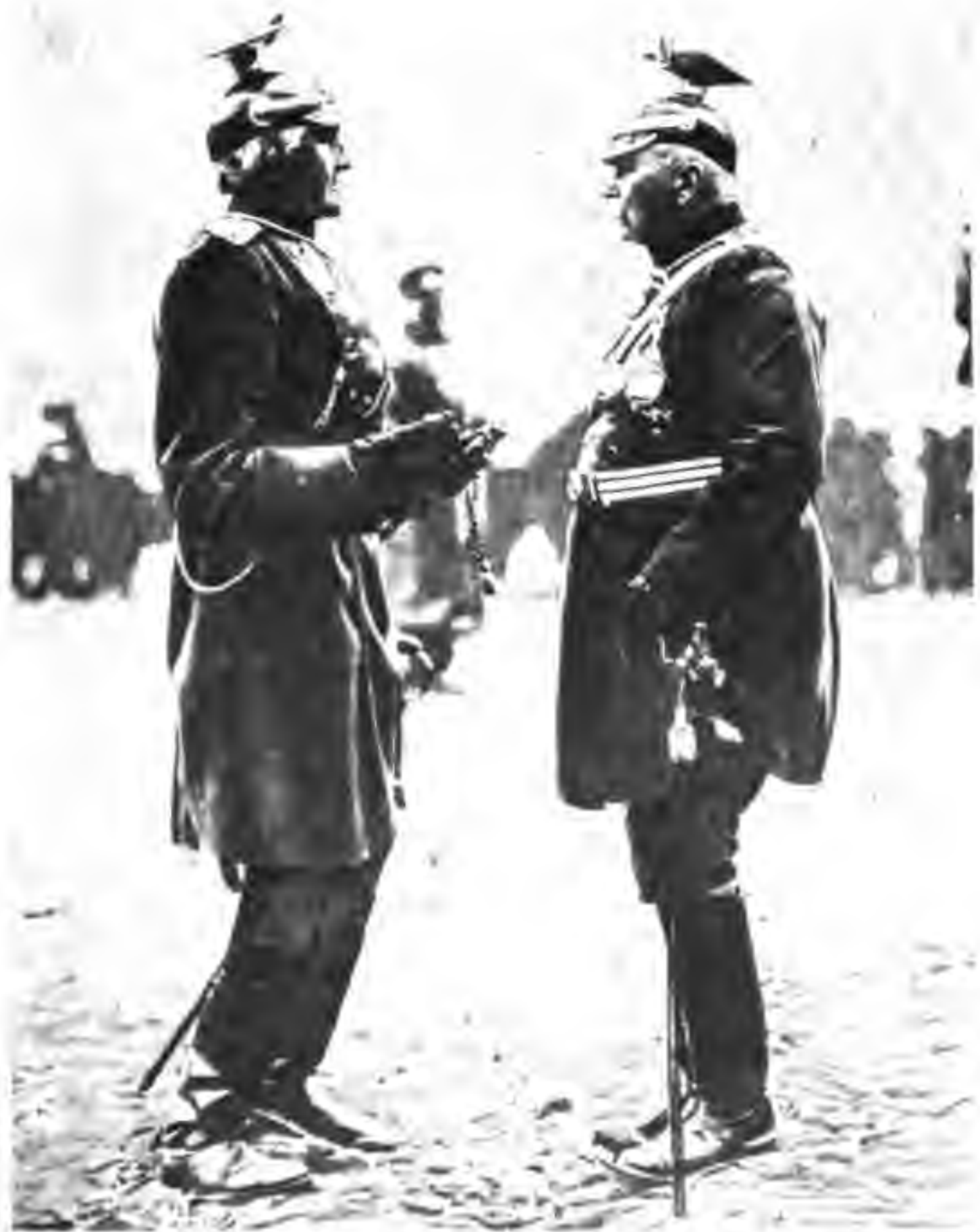
Наши враги: Фельдмаршалъ фонъ-Газелеръ и графъ Цебелинъ.