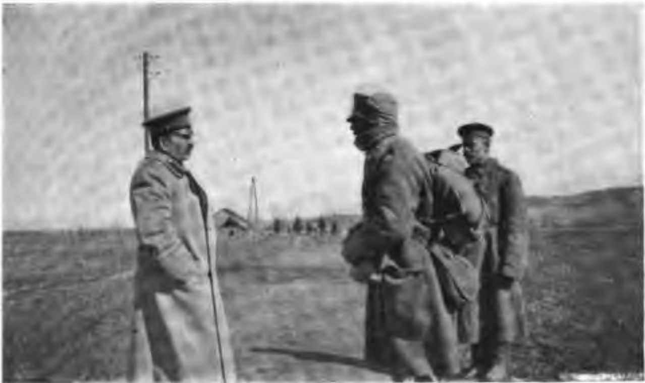
Ген. Радко-Дмитрієвъ разспрашиваєтъ плѣннаго.