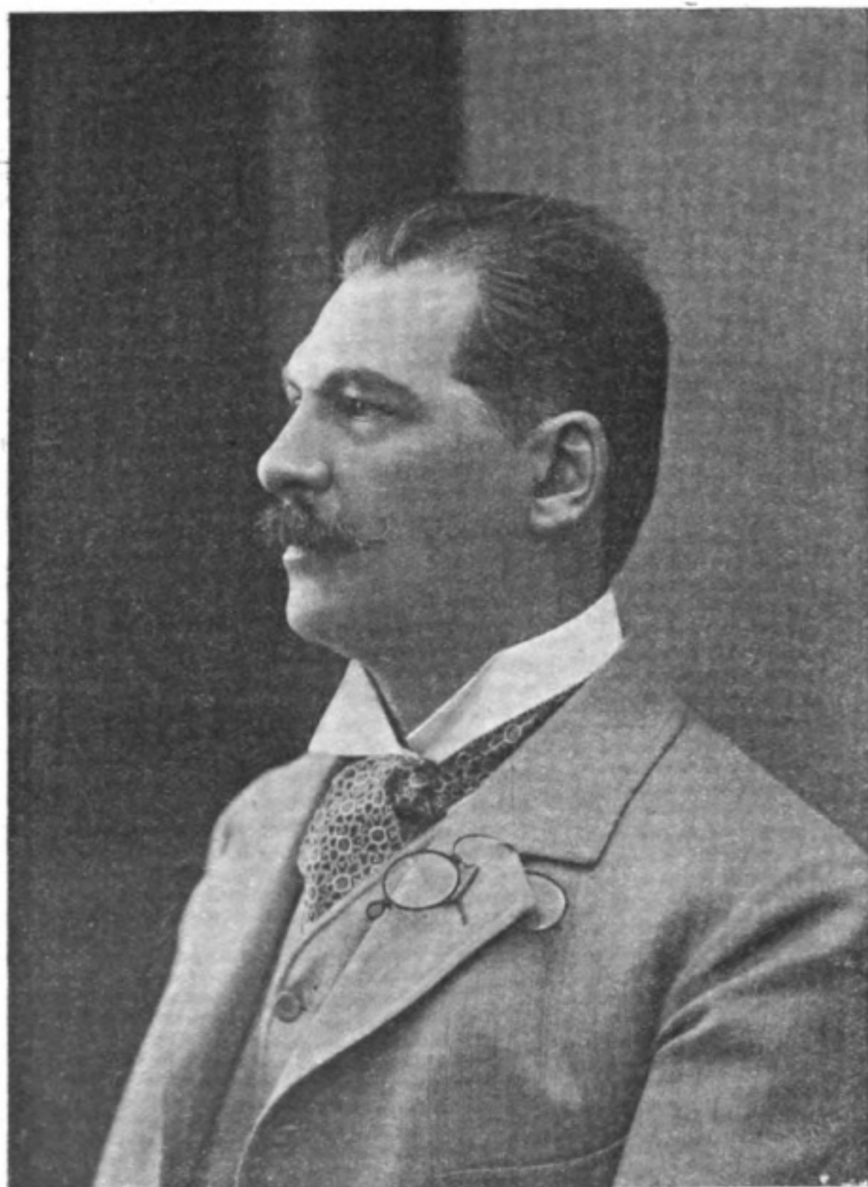
ДЕПУТАТЪ ГОСУДАРСТВЕННОЙ ДУМЫ Князь Серафимъ Петровичъ МАНСЫРЕВЪ.